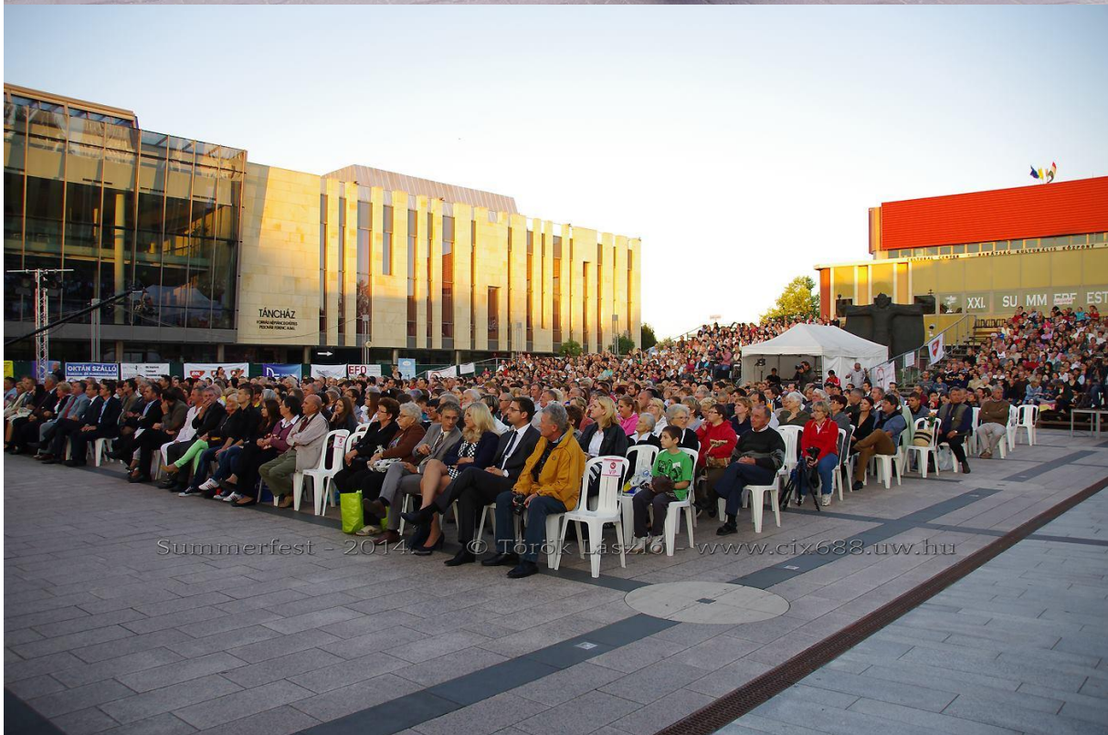
Summerfest - 2014.